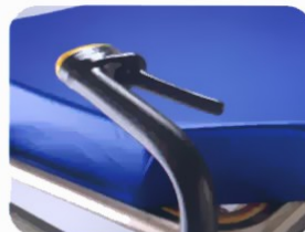
Ενεργό Φρένο Χειρός