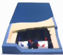
12,7cm Στρώμα Αέρος PrimeAire ARS