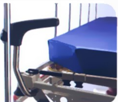
Ενσωματωμένος Μηχανισμός Μεταφοράς Στατό Ορού