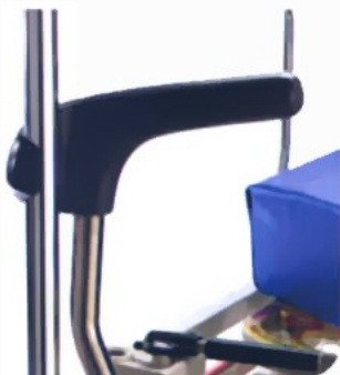
Ενσωματωμένος Μηχανισμός Μεταφοράς Στατό Ορόυ