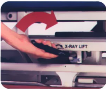
Τοποθέτηση ακτινογραφιών κα' όλο το μήκος

Μέγιστο βάρους .....317,5 kg Ελάχιστο ύψος – από το δάπεδο έως την επιφάνεια κατάκλισης: .....61,6 cm .....με ζυγό 61 cm Μέγιστο ύψος – από το δάπεδο έως την επιφάνεια κατάκλισης: .....95,9 cm .....με ζυγό 95,3 cm Συνολικό μήκος.....210,8 cm Συνολικό πλάτος (με ανεβασμένα τα κάγκελα).....91,4 cm Συνολικό πλάτος (με αποθηκ/να τα κάγκελα).....76,8 cm Μήκος κάγκελων.....119,4 cm Ύψος πλευρικών προστατευτικών επάνω από την επιφάνεια /στρώμα.....36,8 cm Διαστάσεις Στρώματος: .....66cm x 190,5 cm Μέγιστη ανάκλιση πλάτης.....90° Μέγιστο Trend./Rev. Trend...18° Απόσταση από το δάπεδο στη βάση.....8,9 cm Διάσταση τροχών.....20,3 cm