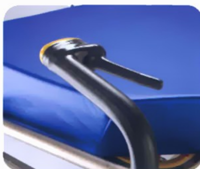
Ενεργό Φρένο Χειρός